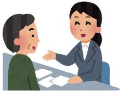
福祉サービスを利用するためのお手伝い