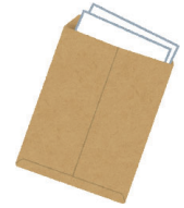
大切な書類のお預かり

上記のような日常生活に必要な支援を提供することで、ご本人にふさわしい生活をサポートすることを目指します。詳細はお問い合わせください。