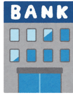
日常なお金の出し入れ、生活費の管理