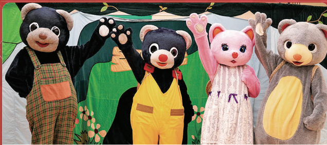
♪劇団こぐま座による ふれあいコンサート♪

みんな集まれ～!! きらくやま子育て支援室こどもひろばでは、今年も年に一度の大イベントを開催します。