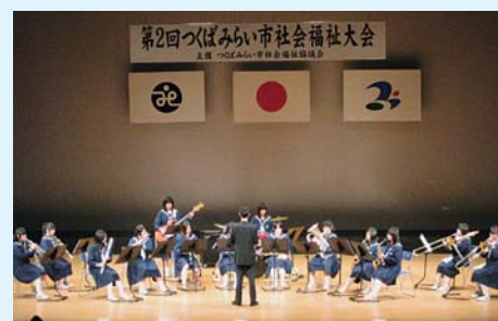
▲ 伊奈東中学校吹奏楽部による演奏