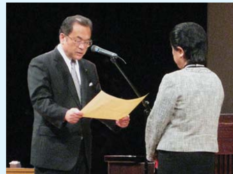
▲ 表彰状授与のようす