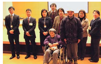
▲ 参加された皆さん

当日は、事例となった家族も参加し「お母さんも元気になって、みんなが家をきれいにしてくれて良かった」と感想を述べられました。