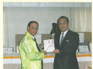
▲ やわらライオンズクラブより