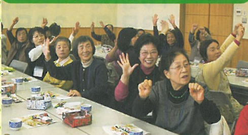
◀ 楽しいひととき (板橋コミセン)