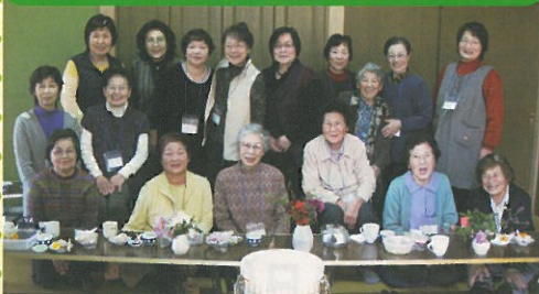
◀ みんな笑顔で (高波公民館)