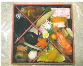
▲おいしそうなおせち