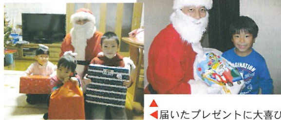
▲届いたプレゼントに大喜び

市内でクリスマスを楽しみに待っていた354人の子どもたちに、サンタクロースに扮したボランティアの方々14名が、素敵なプレゼントをお届けしました。子どもたちは、サンタさんに逢えた喜びとプレゼントに満面の笑みを見せてくれました。