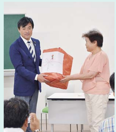
熱中症予防食品を手渡すボラ連会長