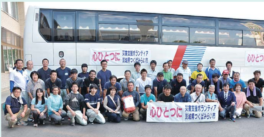
ご協力いただいたボランティアの皆さん

また、ボランティアバス出発式では、市ボランティア連絡協議会より参加者の皆さんへ熱中症予防食品の贈呈式も執り行われました。